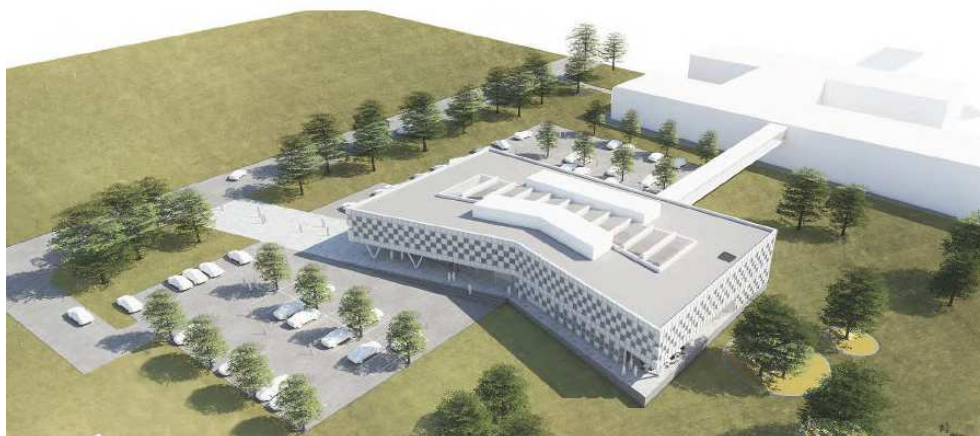
Figur 14 Borregaards nye hovedkontor mellom Stjernebygget og Forskningsbygget. Illustrasjon: AART Architects